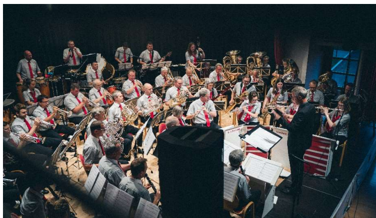
Concerto a Fiss, Bergtöne Fiss, luglio 2022.

Le foto attuali sono disponibili sul sito web www.livebandsbb.ch alla voce "Galleria". Di seguito troverete alcune impressioni.