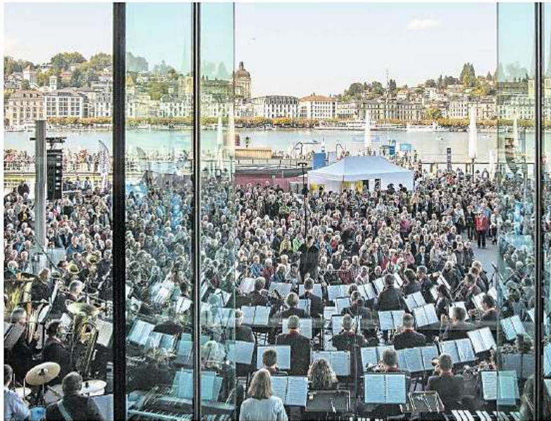
Die Live Band SBB gehörte gestern vor dem KKL zu den stimmungsmässigen Highlights.

Ein spannenderes Kaliber ist die Black Dyke Band aus Schottland, eines der führenden Brass-Ensembles der Welt. Seit 19 Jahren treten sie am World Band Festival auf. Und «seit 19 Jahren ist jedes