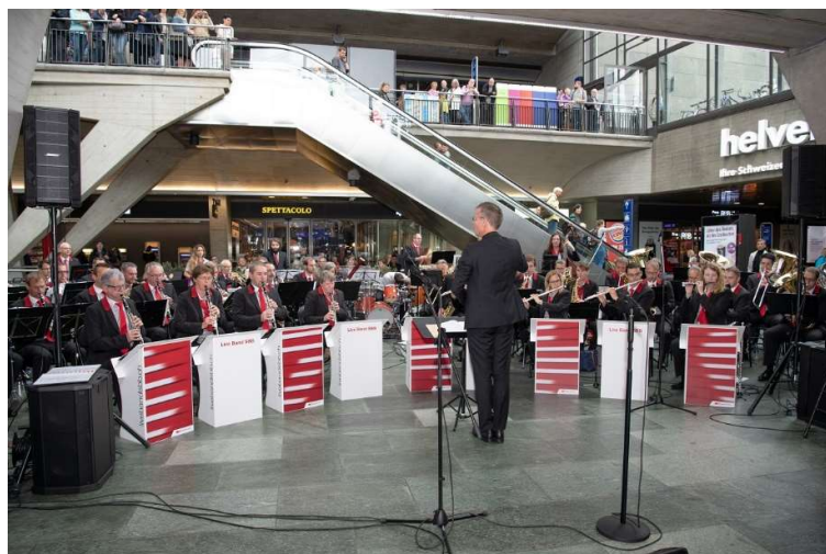
Concerto alla stazione di Lucerna, ottobre 2018.