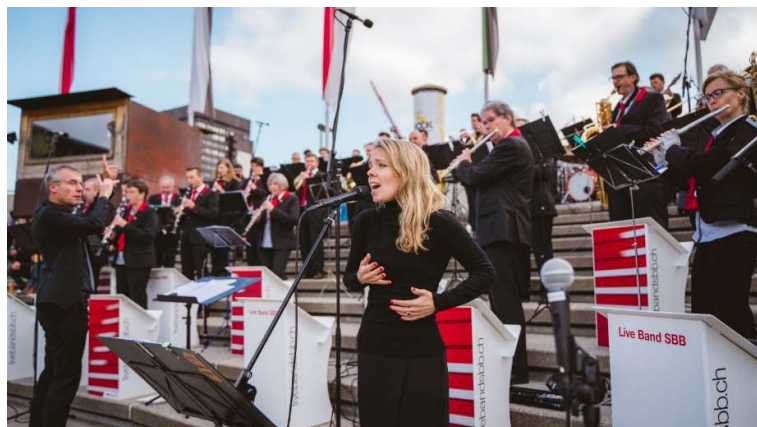
Concerto all'OLMA di San Gallo 2021.